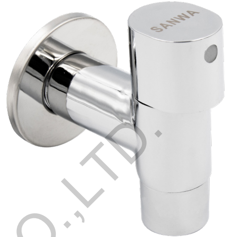
Dimension มิติ (mm.)